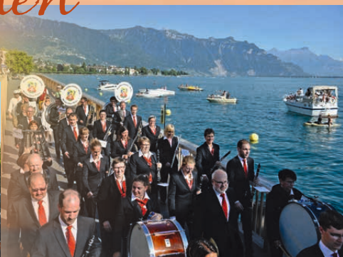
Die Stadtharmonie Winterthur-Töss am Fête des Vignerons 2019 in Vevey.