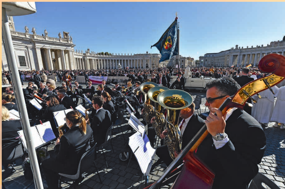
Die Stadtharmonie Winterthur-Töss an der Generalaudienz in Rom 2018.